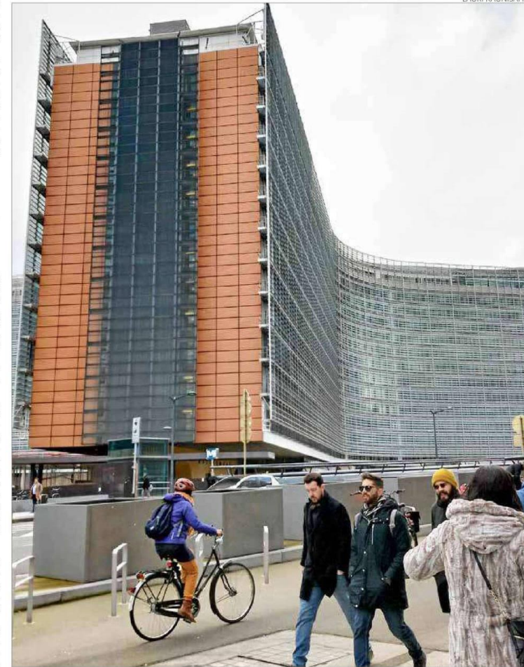
Berlaymont, Euroopan komission päärakennus Brysselissä.