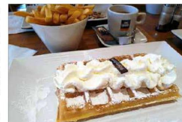
Keskiviikkona poikkesimme Gaufres de Bruxelles -ravintolassa vohveileilla.