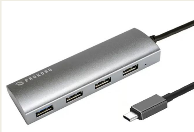
Adapteri, jossa USB-C pää.