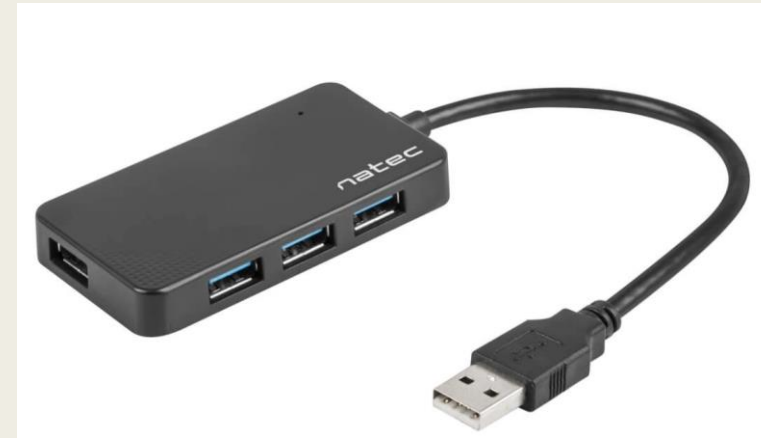
Adapteri, jossa USB-A pää. Muista, että yksi USB-portti pitää olla tyhjänä boottaustikulle!