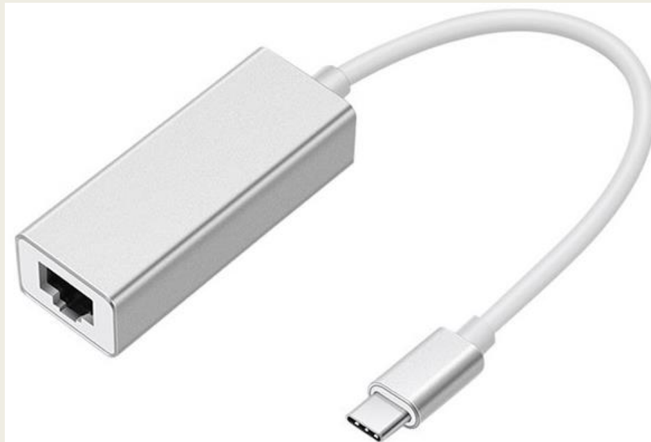
Adapteri, jossa USB-C pää.