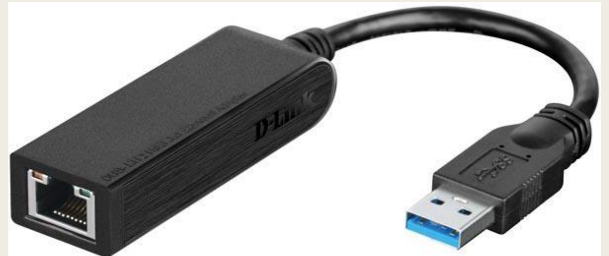
Adapteri, jossa USB pää. Muista, että yksi USB-portti pitää olla tyhjänä boottaustikulle!